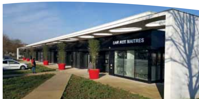
Site des Bleuets à Mont-Saint-Martin.

La certification BREAAAM a été décernée fin septembre au