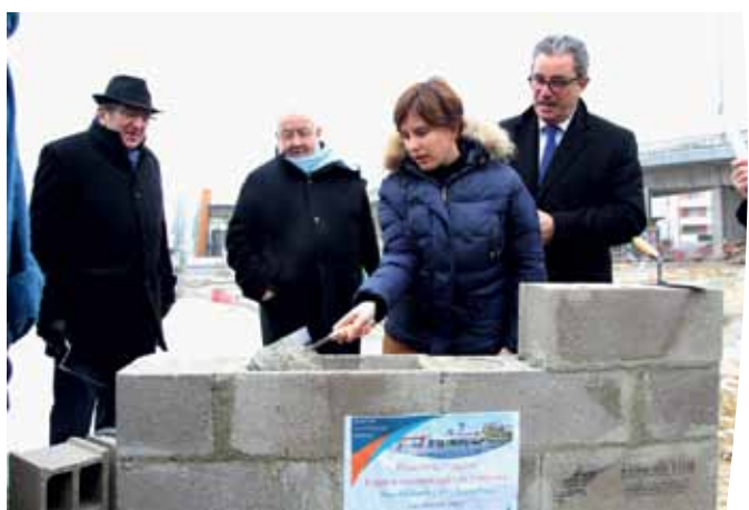
Pose de la 1 re pierre de l'espace commerce Les Embruns – Saint-Max (54)

En 2017, c'est la 1 re pierre de l'espace commercial les Embruns le 24 janvier, à Saint Max près de Nancy, qui aura été le 1 er événement « terrain » de l'année.