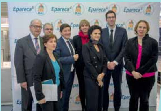
20 ans d'Epareca à Lille.

Cet anniversaire, marqué par 3 temps forts, à Paris le 16 novembre dernier, à Lille le 16 décembre, et le 17 février prochain à Lyon, valorise deux décennies d'intervention de l'établissement,