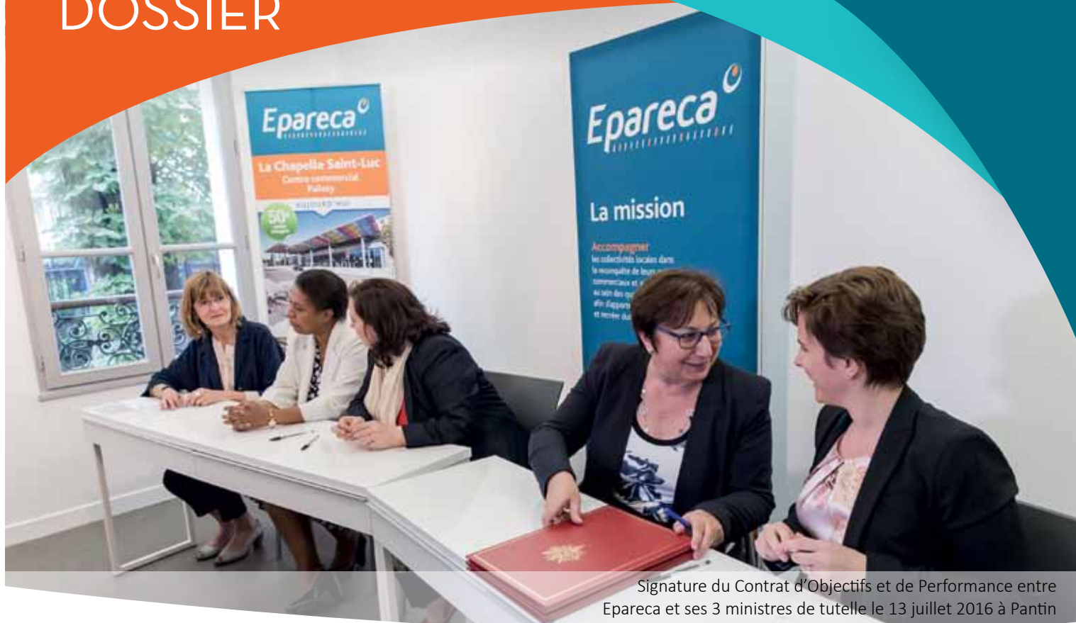
Signature du Contrat d'Objectifs et de Performance entre Epareca et ses 3 ministres de tutelle le 13 juillet 2016 à Pantin