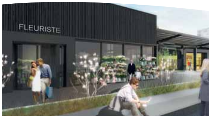
Esquisse du projet de Vitry-le-François – CC Le Hamois (Barrand Corpelet architectes)

Patrick Kanner, ministre de la Ville, de la Jeunesse et des Sports, s'est rendu le 2 septembre dans le quartier du Hamois à Vitry-le-François. Il a rencontré les commerçants