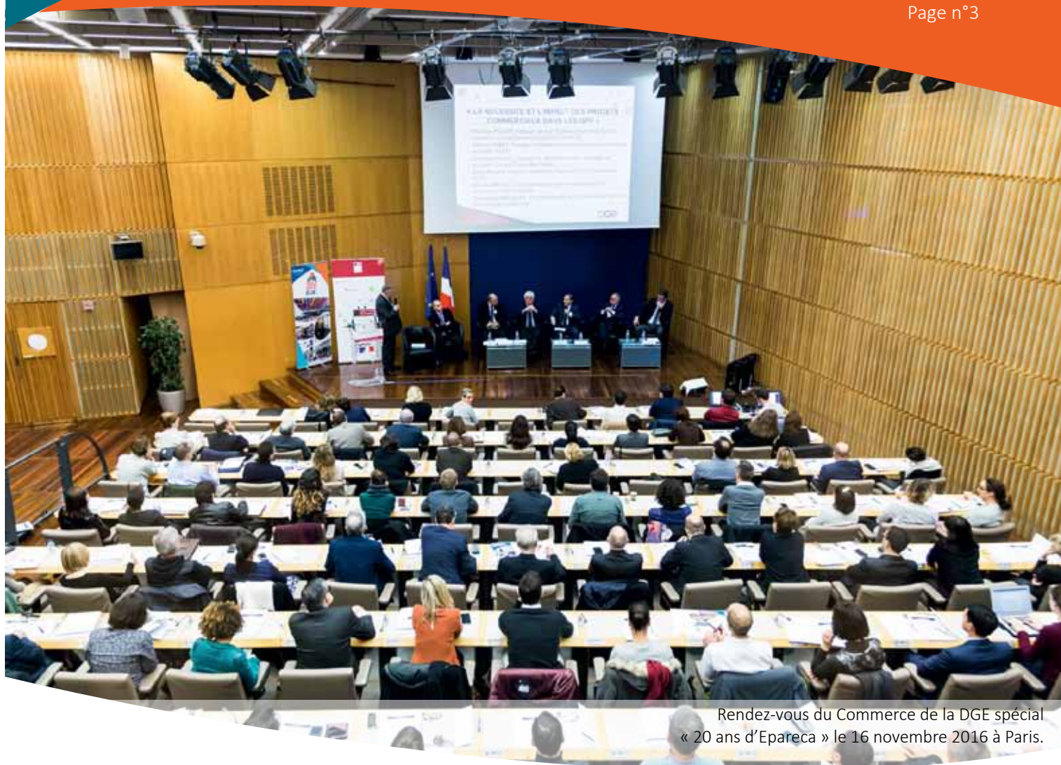
Rendez-vous du Commerce de la DGE spécial « 20 ans d'Epareca » le 16 novembre 2016 à Paris.