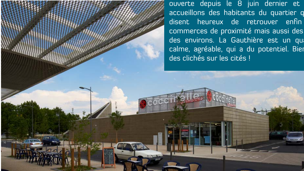
Face aux boutiques, la supérette. Ci-dessous l'intérieur de la supérette et une vue d'un des puits de lumière coloré

Cela fait 30 ans que je travaille dans les quartiers Hlm dont 6 en Auvergne. Pour moi, ce n'est pas plus difficile qu'ailleurs et je trouve qu'il est important que des magasins comme le nôtre puissent se maintenir car les gens en ont vraiment besoin. La supérette est ouverte depuis le 8 juin dernier et nous accueillons des habitants du quartier qui se disent heureux de retrouver enfin des commerces de proximité mais aussi des gens des environs. La Gauthière est un quartier calme, agréable, qui a du potentiel. Bien loin des clichés sur les cités !