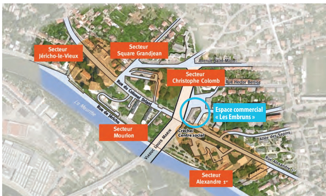
Plan du quartier Saint-Michel / Jéricho